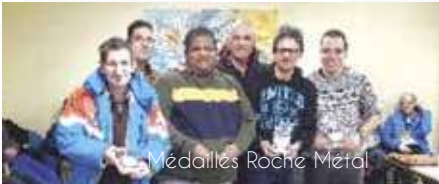
Médailles Roche Métal